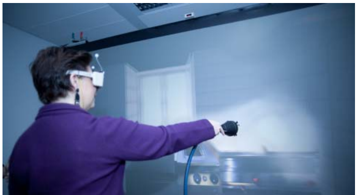
StS Marek bedient einen virtuellen Feuerlöscher